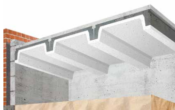
Ribcassettevloer zonder Easy Inserts Bouwjaar van 1983 tot 1992. Rc = 1,3 m2K/W