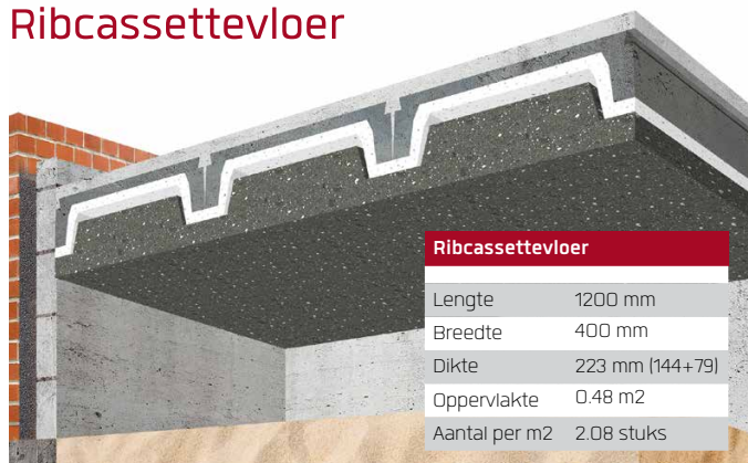
Ribcassettevloer met Easy Inserts Rc-waarde totale vloerconstructie = 4,82 m2K/W