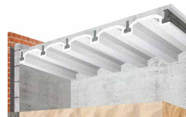
PS-insulatievloer zonder Easy Inserts Bouwjaar van 1983 tot 1992. Rc = 1,3 m2K/W